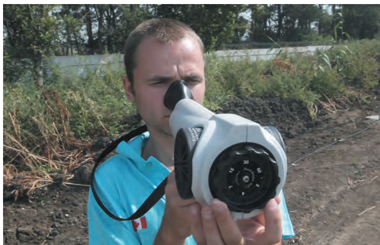
Рис. 2. Полевые исследования запаха