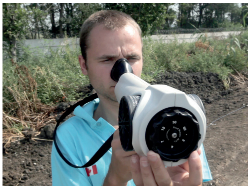
Рис. 3. Измерения с помощью ольфактометра Nasal Ranger

Эксперт начинает измерения с наименьшего расхода неочищенного воздуха, т.е. с наибольшего разбавления, и продолжает измерения, пока не почувствует запах и не зафиксирует пороговое значение в единицах D/T (Dilution-to-Threshold — «разбавление до порога»). В отличие от динамической ольфактометрии, где обычно имеют дело с относительно стабильными выбросами, полевые измерения запаха проводятся многократно и в течение длительного времени, т.к. в большинстве случаев в атмосферном воздухе запах появляется периодически, а его интенсивность значительно варьируется в зависимости от метеоусловий (см. сн. 4).