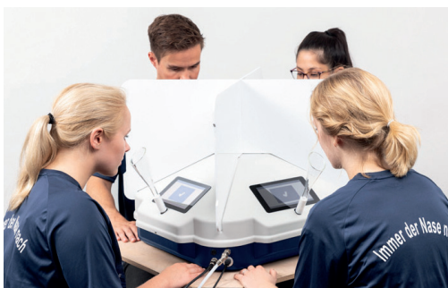
Рис. 2. Измерения с помощью ольфактометра TO8 evolution

Затем, но не позже, чем через 30 часов после отбора, проба поступает на анализ в лабораторию, где она с помощью ольфактометра (рис. 2) разбавляется в разных соотношениях нейтральным воздухом без запаха и с заданной скоростью подается на анализ аттестованным членом экспертной комиссии, которые должны определить наличие или отсутствие запаха в образцах. Результатом таких измерений является концентрация запаха в исходной пробе, которая измеряется в единицах запаха на кубический метр (ЕЗ/м 3 ). Численно это